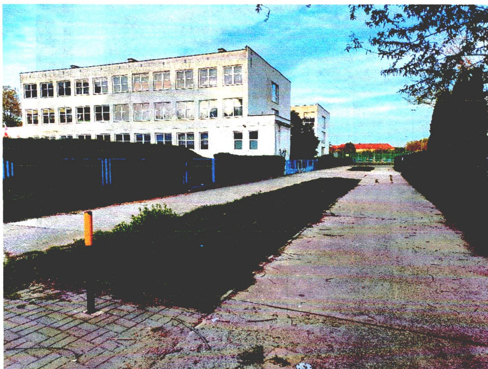
Widok na przedmiotowy teren – stan na kwiecień 2024