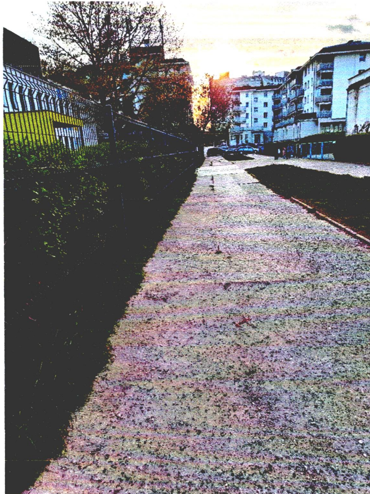
Widok na przedmiotowy teren – stan na kwiecień 2024 – widok stanu nawierzchni betonowej na ciągu komunikacyjnym oraz fragment ogrodzenia wyremontowanego żłobka.