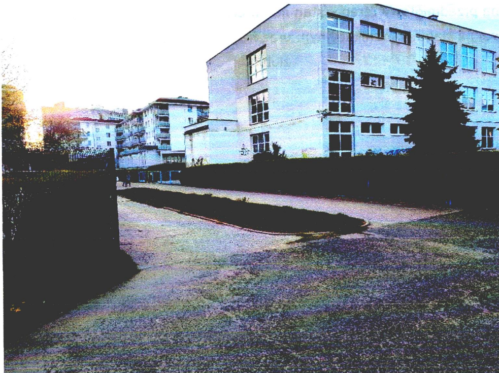
Widok na przedmiotowy teren – stan na kwiecień 2024