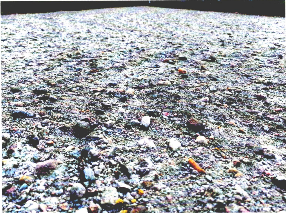
Widok na przedmiotowy teren – stan na kwiecień 2024 – widok stanu nawierzchni betonowej na ciągu komunikacyjnym.