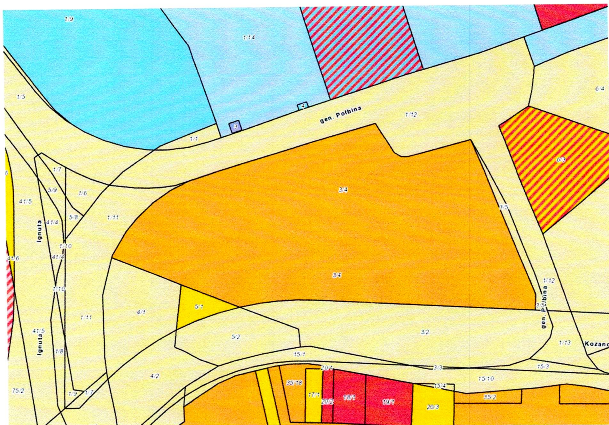
Działka 3/4 AR-4, obręb Kozanów, ul. Kozanowska 69.

Jednocześnie informujemy, że zarówno mieszkańcy, jak i Rada Osiedla wyrażają stanowczy sprzeciw przeciwko zmianie użytkowania przedmiotowej działki. Domagamy się podjęcia takich działań, które będą prowadziły do dalszego funkcjonowania hali sportowej, z której korzystają setki dzieci oraz dorosłych z naszego osiedla. Są to osoby uczęszczające na różnorodne zajęcia sportowe.