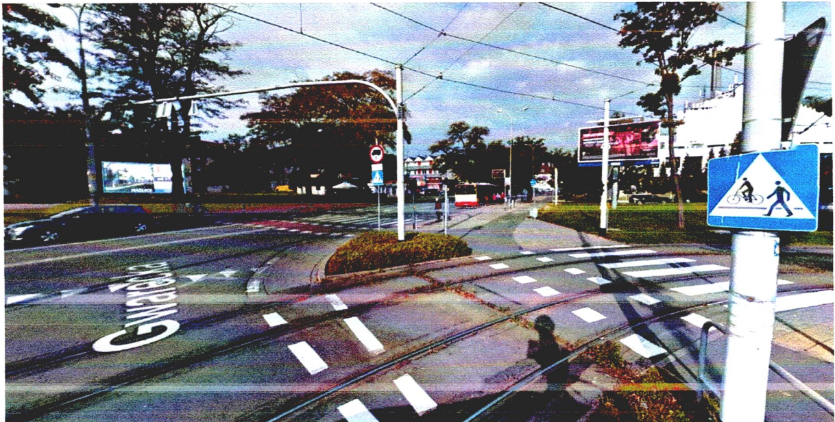
Widok od ul. Gwareckiej – przejście dla pieszych wprost na ścieżkę rowerową, którą dalej piesi idą do kościoła.