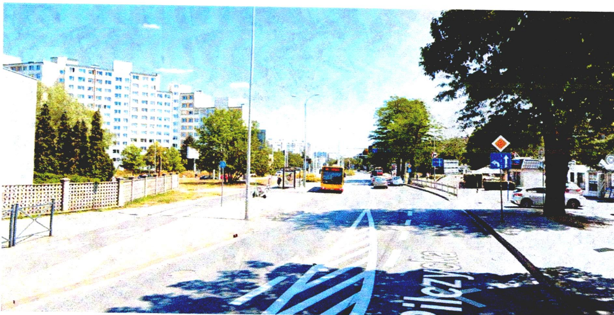
Widok od ul. Pilczyckiej – wąskie przejście chodnikiem pomiędzy przystankiem a jezdnią. Niewystarczające dla kilkuset ludzi wychodzących z kościoła.