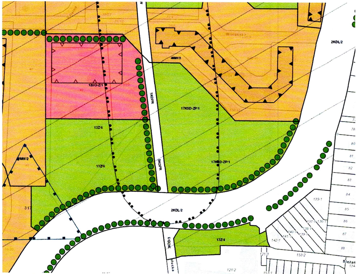
Przedmiotowe działki na podkładzie mapy MPZP