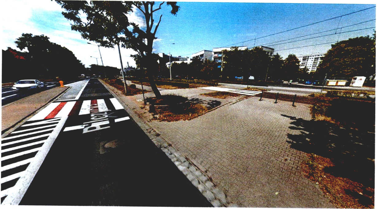
Wjazd w ul. Sielską od strony ul. Pilczyckiej