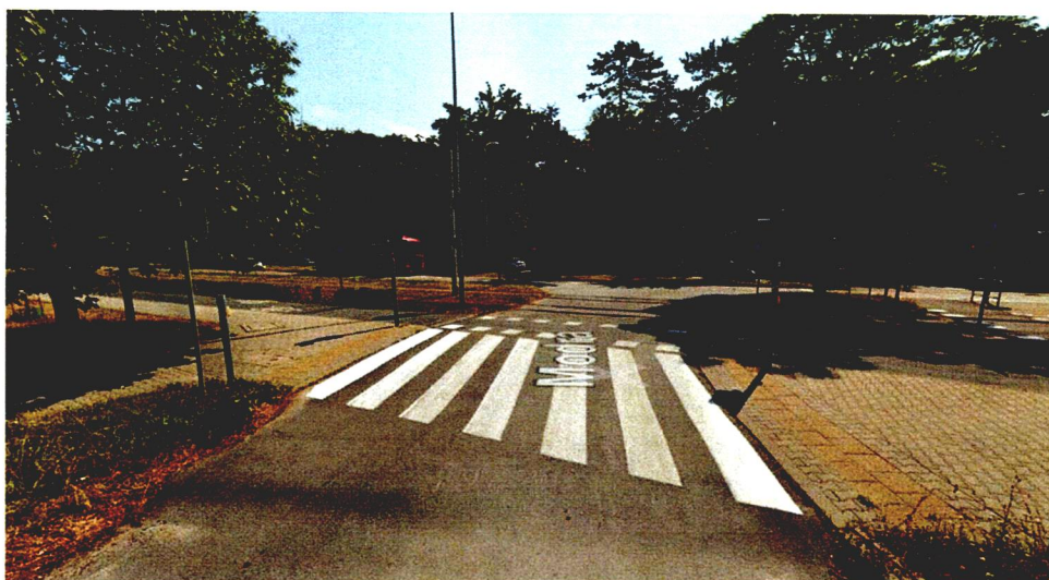
Przejście przez ul. Modrą, wyjazd z osiedla