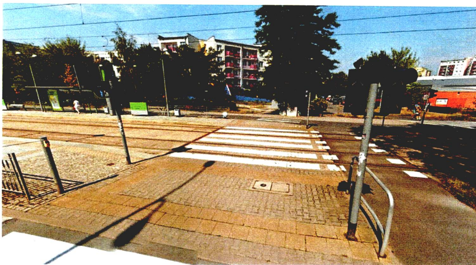
Przystanek Pilczycka (ANIMA), przejście przez torowisko

W związku z powyższym wnosimy o przyjrzenie się sprawie i włączenie sygnalizacji świetlnej na przejściu przez torowisko przy przystanku tramwajowym Pilczycka (ANIMA) oraz przez ul. Modrą (kostkową). Jeśli to możliwe preferowalibyśmy sygnalizację uruchamianą na żądanie (tak jak to funkcjonowało przed wyłączeniem). Do uzasadnienia dołączamy petycję Rady Rodziców działającej przy Szkole Podstawowej nr 33. Dodatkowo wnosimy o przeprowadzenie zajęć edukacyjnych w Szkole Podstawowej nr 33, podczas których Policja lub Straż Miejska opowie dzieciom, w jaki sposób prawidłowo i bezpiecznie przechodzić przez jezdnie, a szczególnie jak to robić na przejściach bez sygnalizacji świetlnej.