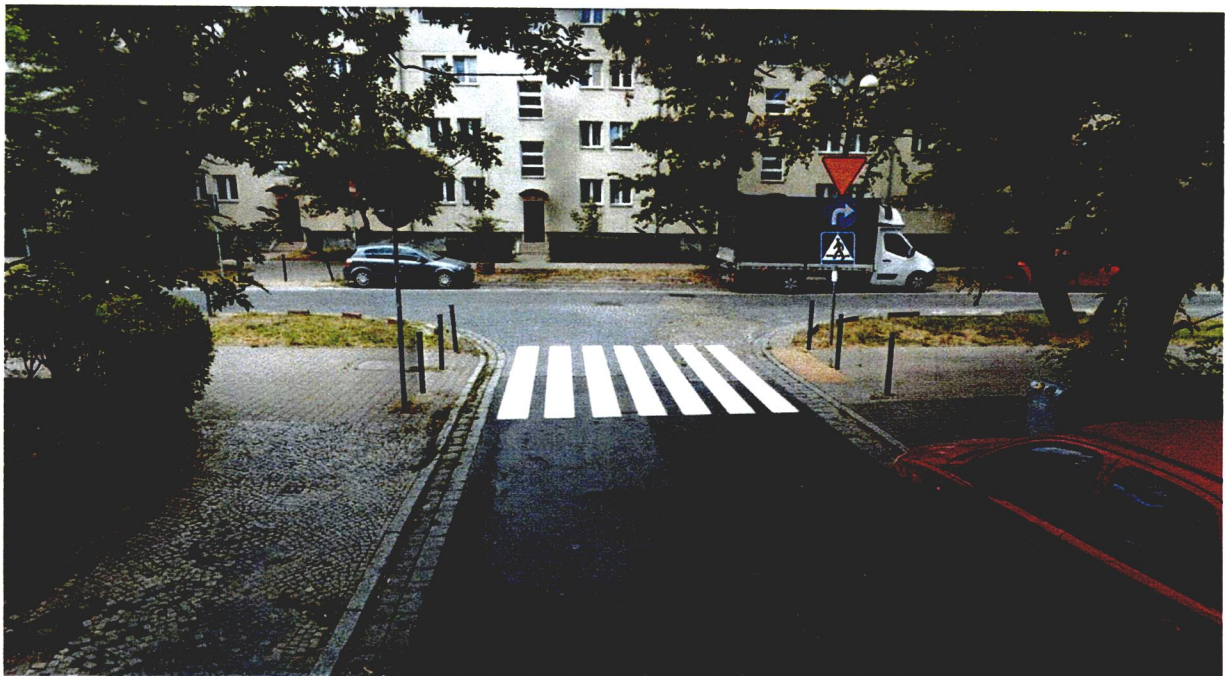
Wizualizacja przejścia dla pieszych ulica Szklarska-Górnica.

Analogicznie należałoby oznakować przejście dla pieszych na skrzyżowaniu ulicy Szklarskiej z ulicą Górnica, by kompleksowo zwiększyć bezpieczeństwo pieszych idących zarówno wzdłuż ulicy Hutniczej jak i Górnicej.