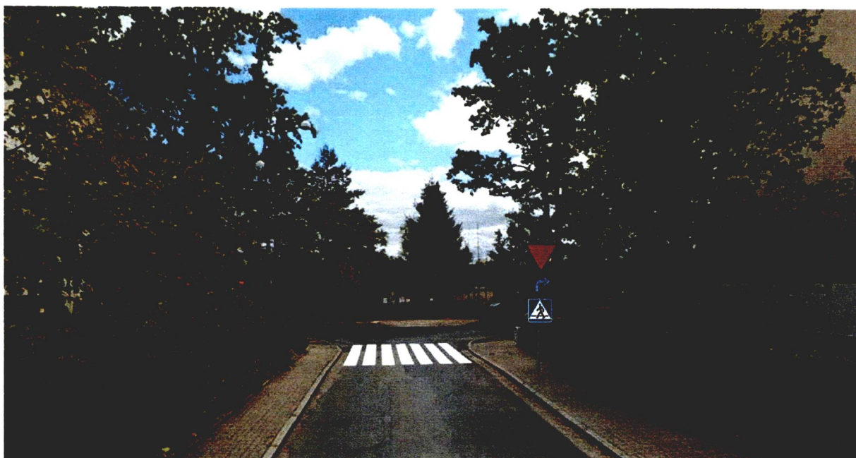
Wizualizacja przejścia dla pieszych ulica Szklarska-Hutnicza.

Przejście dla pieszych w tym miejscu z oznakowaniem pionowym (znak D-6) i poziomym (znaki P-10) spowoduje, że kierowcy widząc przejście będą zwalniać, by przepuścić pieszych (zgodnie z obowiązującymi przepisami).