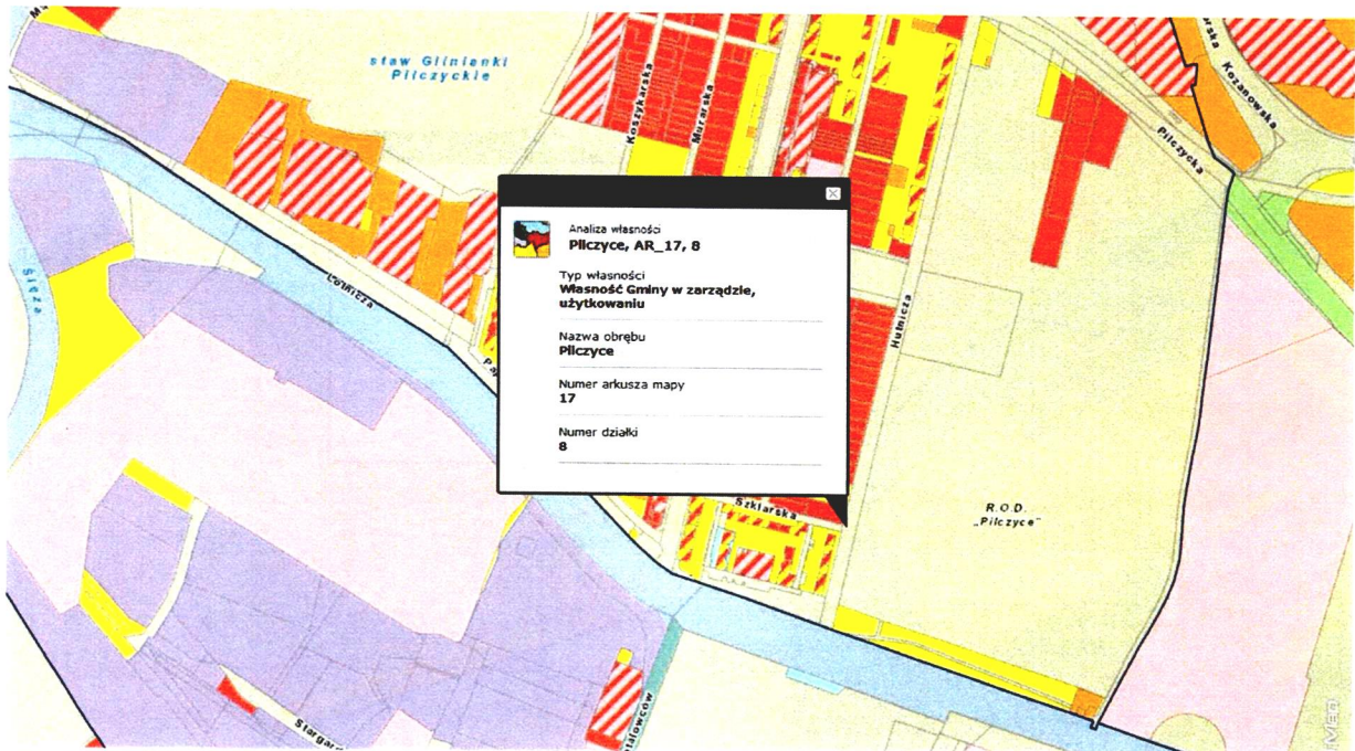
Działka 8 AR-17, obręb Pilzno

Analogicznie należałoby oznakować przejście dla pieszych na skrzyżowaniu ulicy Szklarskiej z ulicą Górnica, by kompleksowo zwiększyć bezpieczeństwo pieszych idących zarówno wzdłuż ulicy Hutniczej jak i Górnicej.